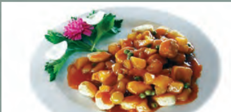
Pește în 5 culori