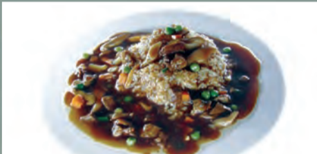
Orez cu legume și topping de vită