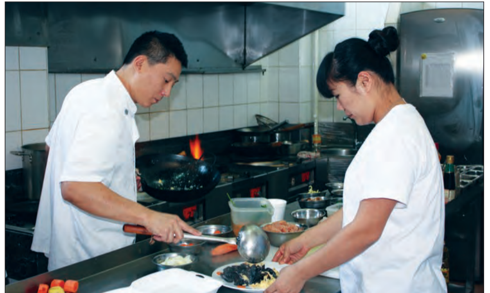
Maestrii bucătării vin direct din China, iar rezultatul este impresionant

Prima cărămidă au pus-o în februarie 2009. După ceva mai bine de jumătate de an, pe 19 iulie 2009, restaurantul și-a deschis porțile. Au decis să îl numească Zen, cu toate că nu are legătură cu bucătăria chinezească. „Numele nu e chinezesc, Zen e toată filosofia asiatică de meditație, relaxare, armonie. Nici bucătarii noștri nu au fost de acord cu el, pentru că nu are legătura cu mâncarea. Totuși ne-am dorit să fie un nume care să aibă