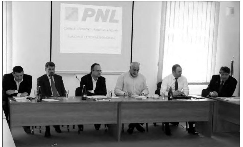
Subcomisia de Energie Neregenerabilă a PNL s-a reunit la Mediaș

Potrivit liderului liberal, România se află în momentul de față la nivelul anilor 1960 ca și număr de salariați. „În decembrie 2010, România a ajuns la numărul de salariați din economie pe care îi avea în deceniul 6. Nu am mai avut de 50 ani 4 milioane de salariați. În doi ani am pierdut aproape un milion de salariați. Acest succes al reluării creșterii trebuie să fie moderat, pentru că în acești doi ani România a pierdut aproape un milion de salariați, a pierdut în același timp 10% din Produsul Intern Brut și a «câștigat» 25 de milioane de Euro datorie publică. Tre-