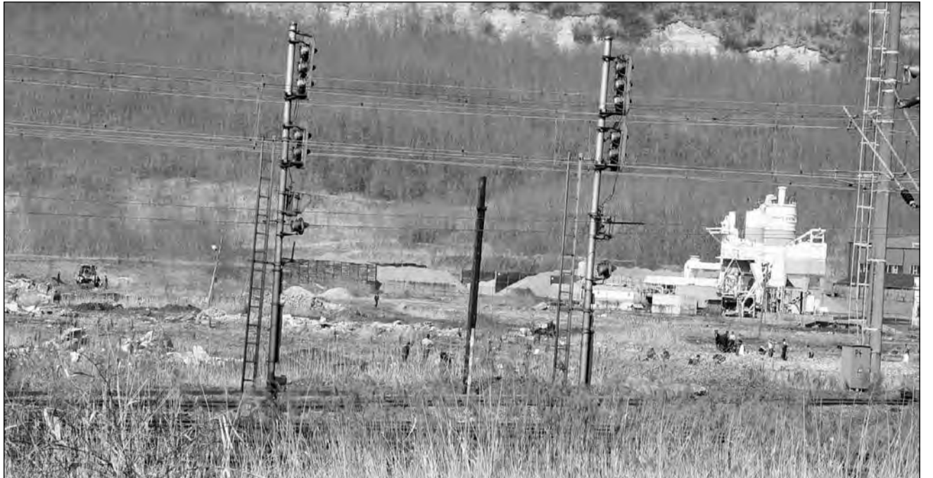
Speranța de viață este mai scăzută cu până la zece ani în zonele afectate de poluare

Pentru că speranța de viață este mai scăzută cu până la zece ani în zone afectate de poluare, în noua lege a pensiilor s-a prevăzut o reducere a vârstei standard de pensionare cu doi ani. Facilitatea este menționată în lege la secțiunea care reglementează pensia anticipată parțială, ceea ce înseamnă că persoanele care vor