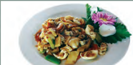
Crizanteme de sepie