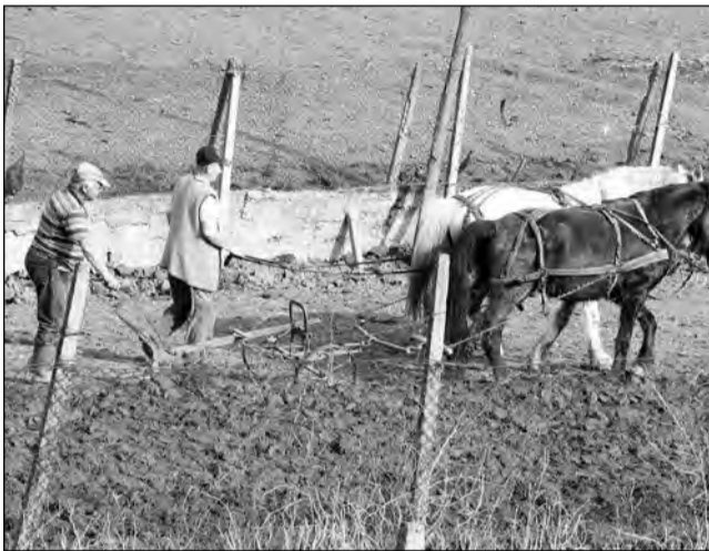
Doar puțin peste jumătate din terenurile agricole sunt cultivate

Dacă nu pot să-și cultive pământul, dar nici nu-i lasă ini-