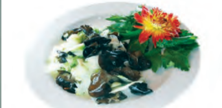
Salată de morcovi cu urechi de copac

Din noiembrie anul trecut, Restaurantul Zen a oferit o alternativă nouă de servire a mesei de prânz. Astfel, sub genericul „All you can eat”, timp de o oră se poate mânca orice din 11 feluri.