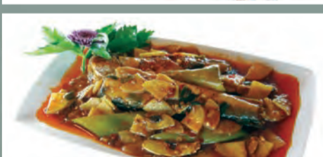
Păstrăv marinat Xihu