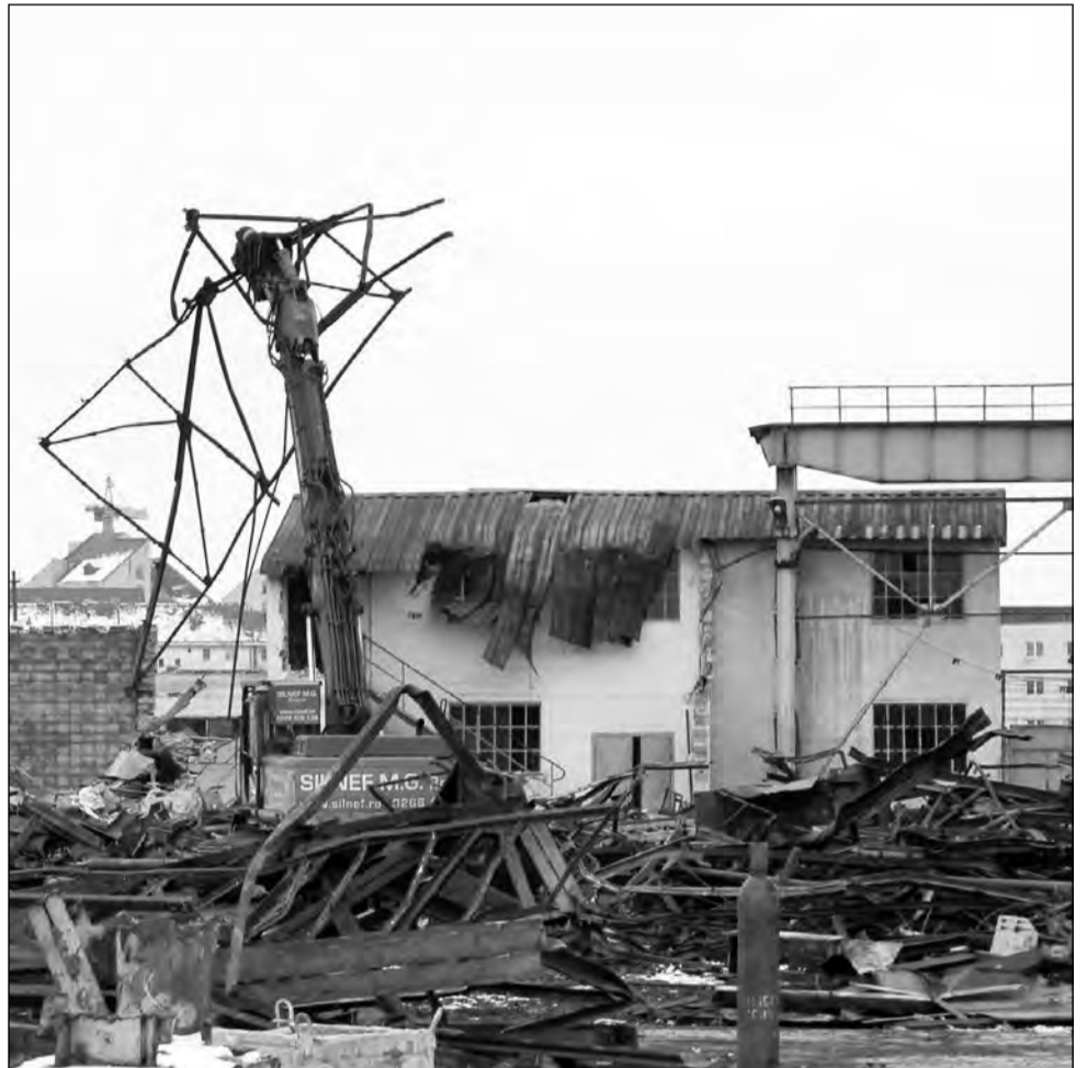
Mediașul ar putea deveni primul oraș din România cu un sistem complet de gestionare a deșeurilor

În municipiul de pe Târnavă Mare este în plină desfășurare un proiect în valoare de 2,4 milioane de euro intitulat „Parteneriat pentru un mediu curat, reducerea deșeurilor și dezvoltare durabilă în Regiunea