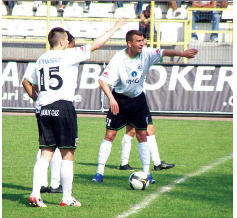
Gaz Metan a presat cu toate liniile, dar n-a reușit să marcheze

De cealaltă parte, tehnicianul Ioan Ovidiu Sabău a criticat arbitrajul centralului Lucian Rusandu, aflat la primul său meci în prima ligă. Antrenorul mureșenilor a explicat că nu i se pare normal ca arbitrii să facă experimente. „A fost un rezultat care mă mulțumește, deoarece am luat un punct de la o echipă care ocupă un loc bun în clasament. Consider că 95% am scăpat de retrograda-