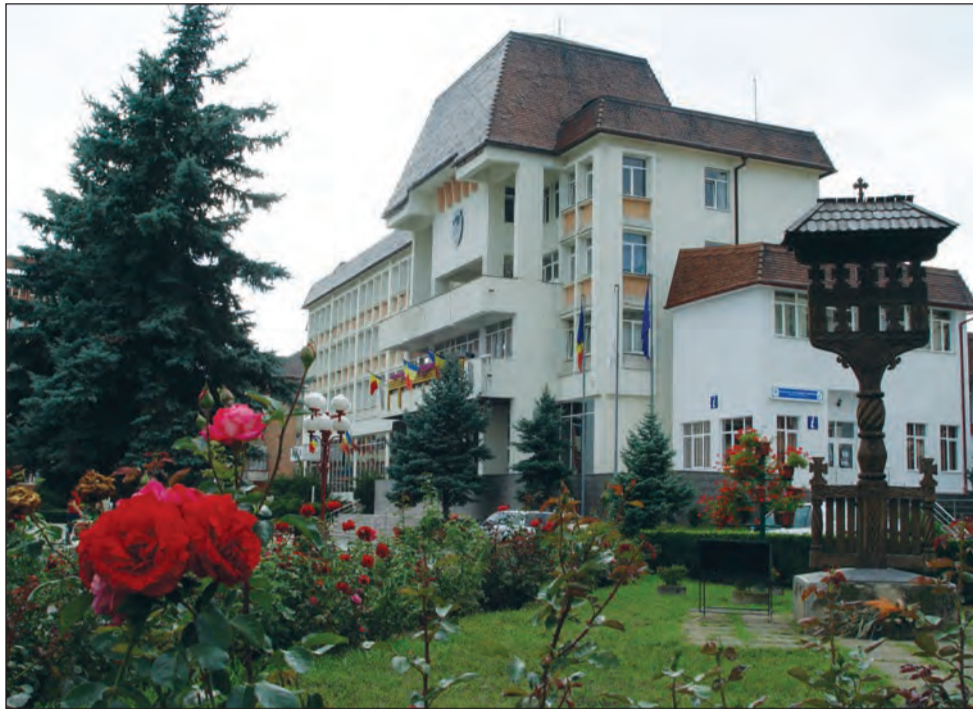
Administrația locală și-a propus să facă din Mediaș un oraș al florilor

Maternitatea verde de pe strada C. Brâncoveanu produce circa 40.000 de răsaduri anual, în două tranșe, odată primăvara și odată toamna, iar toate florile din seră și solare sunt destinate a înfrumuseța zonele verzi. „Este o muncă migăloasă, care cere multă dăru-